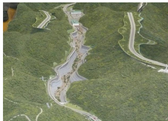
かながわ環境整備センター 管理型最終処分場模型