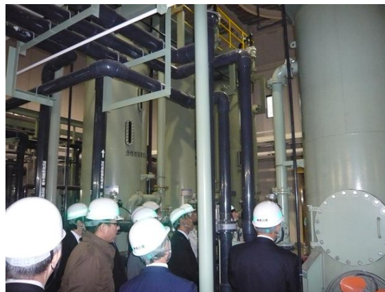
かながわ環境整備センター 浸出水処理施設