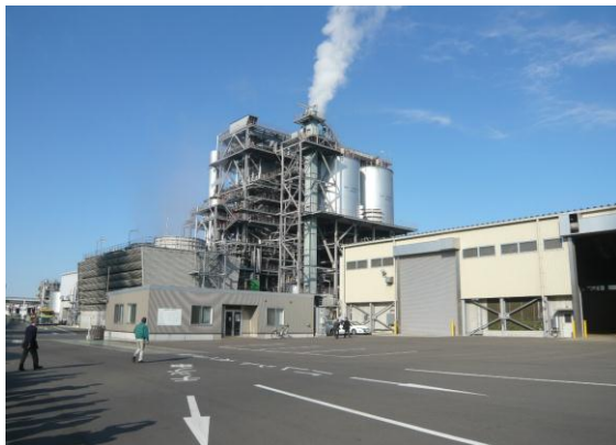
ジャパンバイオエナジー(株) 川崎バイオマス発電(株)