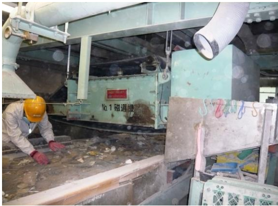
(株)光洲産業 破碎・粗選別ライン／磁選機