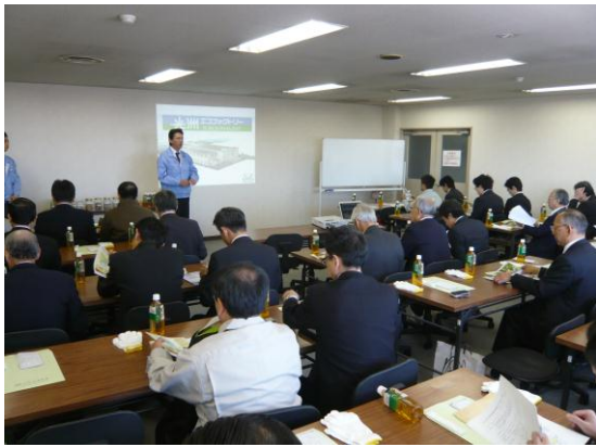
(株)光洲産業 中間処理施設概要説明