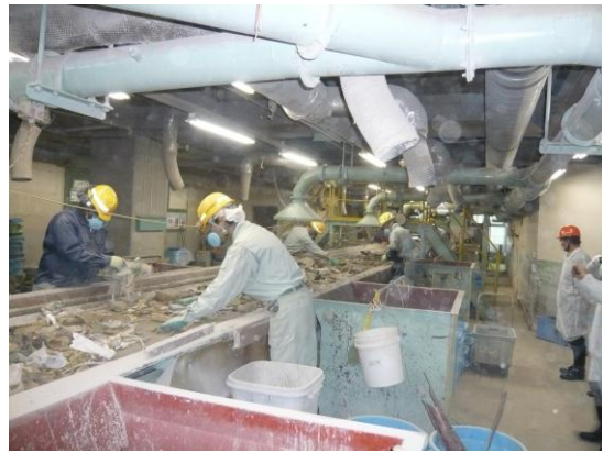
(株)光洲産業 破碎・粗選別ライン／手選別 (このあと磁選機を通して粗選別機へ)