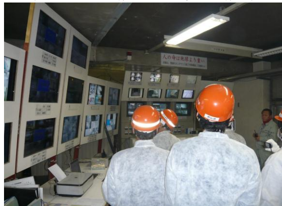
(株)光洲産業 中央操作室