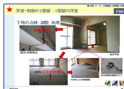
【施工マニュアルが新しくなりました】